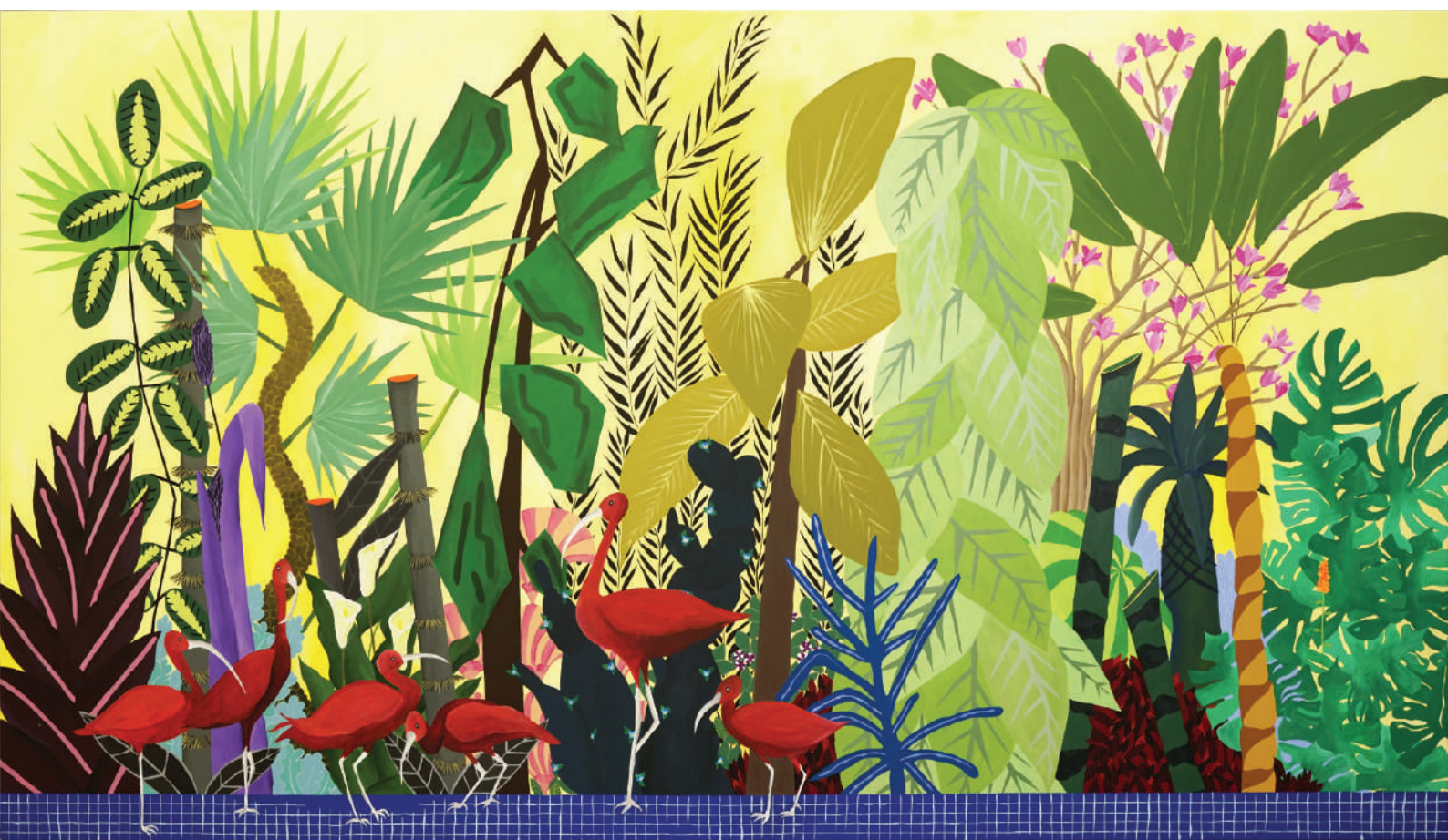
Iseult Perrault La dame bleue , 2018 Acrylique sur toile 180 x 300 cm