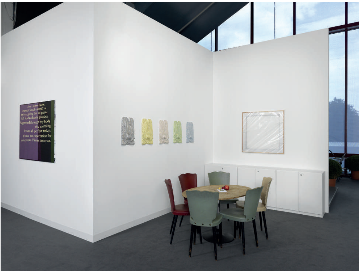
Iseult Perrault Octopus, 2017 Résine 80 x 40 x 4 cm

Quelle est la relation que les femmes entretiennent avec la nature ? Et qui est Gaia ?