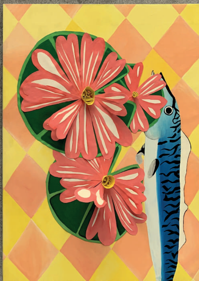
Iseult Perrault Pool flour A, B, C et D , 2019 Acrylique sur toile 80 x 60 cm chacune