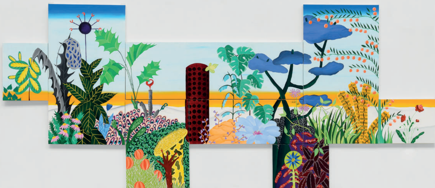
Megapixel I , 2022 Acrylique sur toile Polyptyque : 8 toiles - 343 x 152 cm Oasis I Paris I France