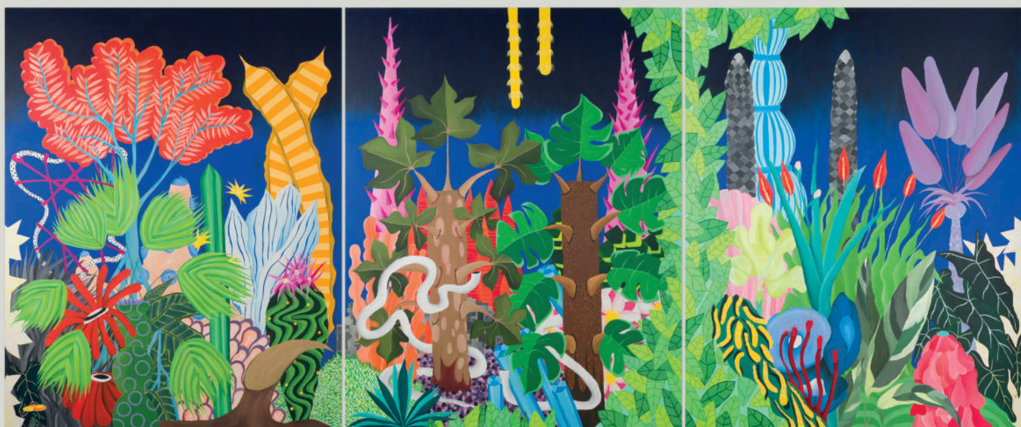
Iseult Perrault Between Dog and Wolf , 2020 Acrylique sur toile Triptyque : 153 x 366 cm (153 x 122 cm x 3)