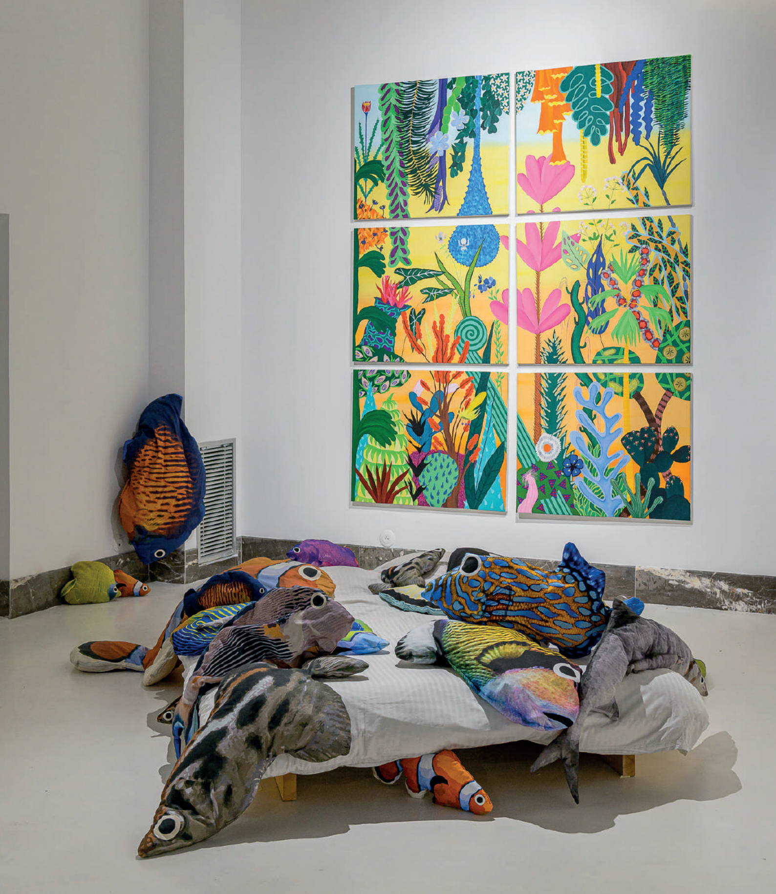
Iseult Perrault Les portes de cornes , 2021 Acrylique sur toile et impression sur toile biologique Polyptique : 240 x 200 cm (100 x 80 cm x 6) et dimensions variables