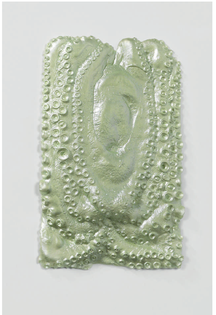
Iseult Perrault Octopus , 2017 Résine 80 x 40 x 4 cm x 5