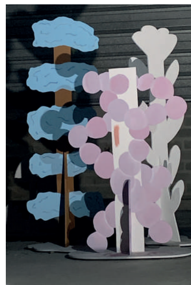
Iseult Perrault Lave-Oeil , 2020 Acrylique sur bois Série de 28 arbres de dimensions variables entre 30 et 300 cm