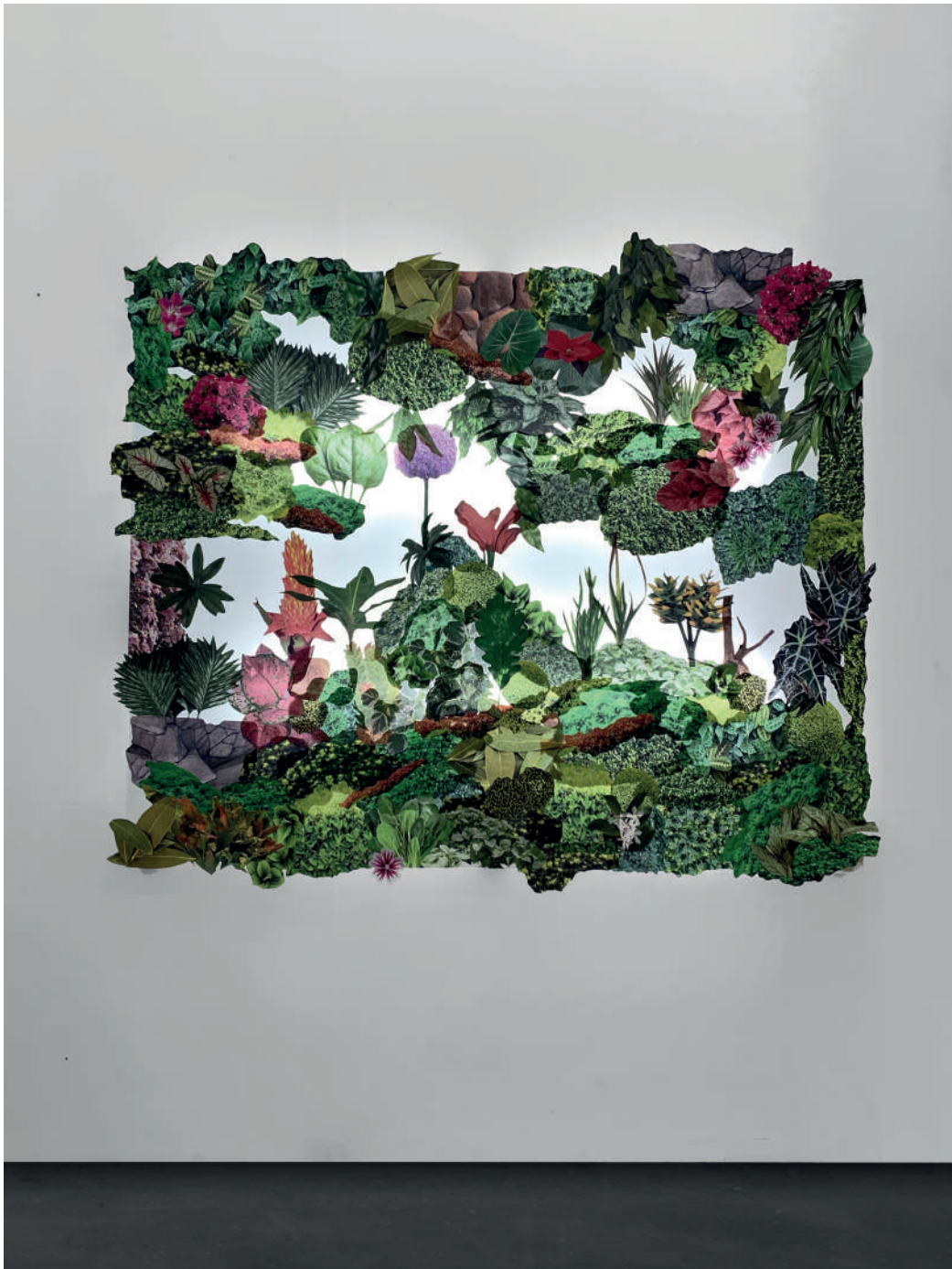
Landscape I, 2019 Papier découpé, plexiglass et néon 150 x 120 cm

La représentation d'un paysage vu d'un endroit particulier est originaire de la peinture hollandaise du 17e siècle. Si l'on s'appuie sur l'idée que le paysage est, avant toute chose, une représentation de la nature par la main de l'homme, de l'artiste, on peut considérer que le paysage n'est jamais sauvage ou naturel.