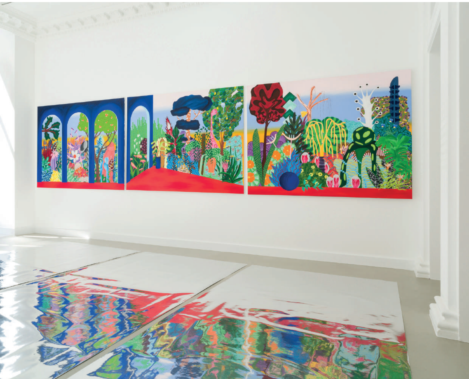
Hortus - Vue d'exposition