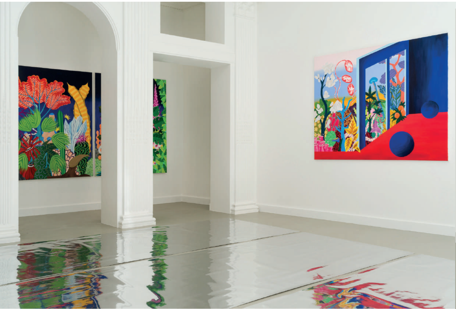
Hortus - Vue d'exposition