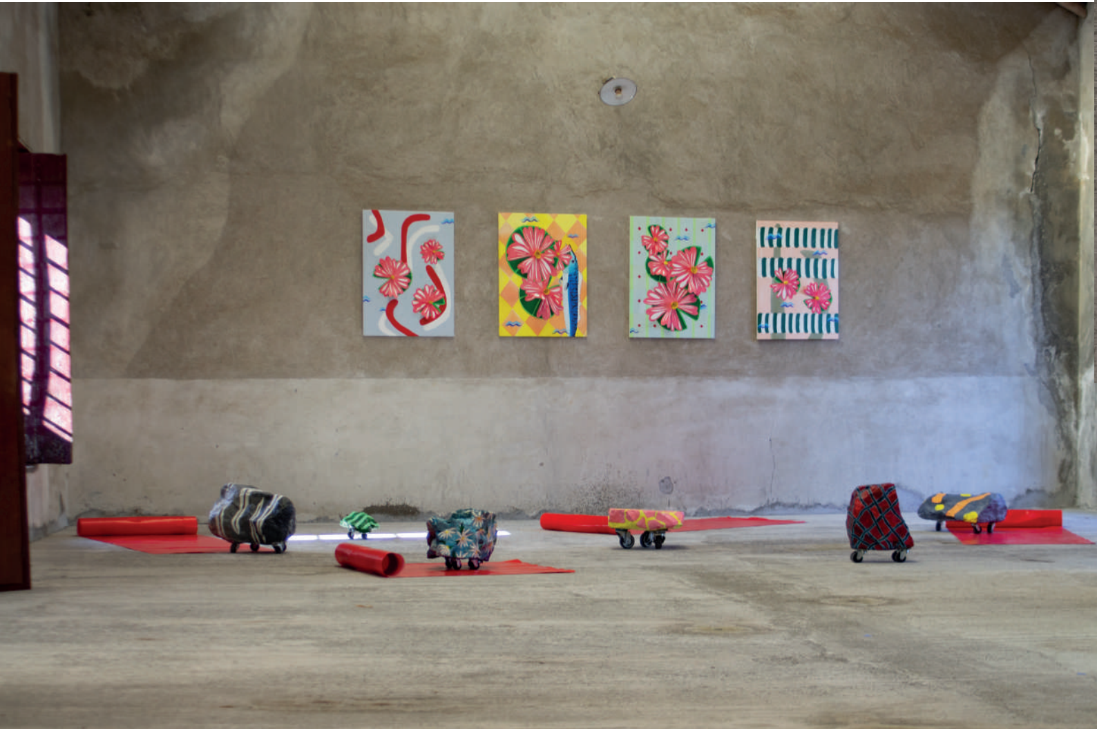
Citronella | Vue d'exposition | Résidence SARP | Sicile | Italie | 2019