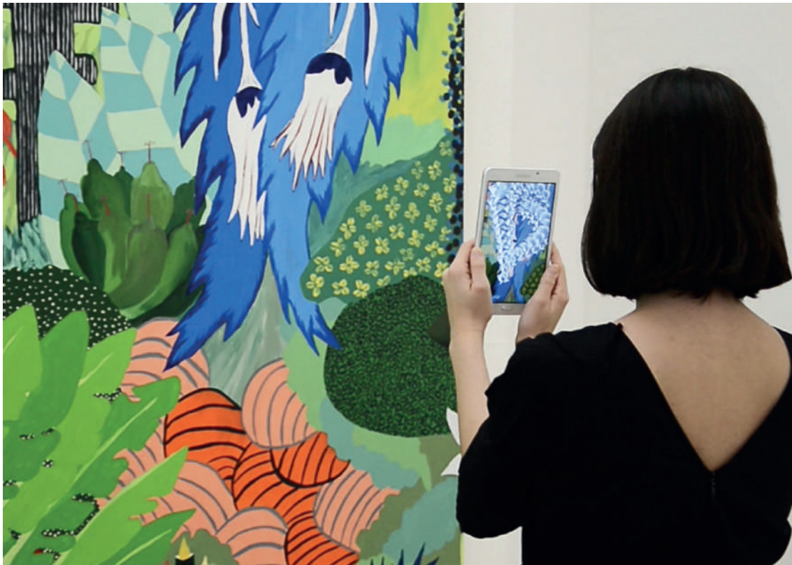
After Eden, Vue d'exposition, 2018 Iseult Perrault Touch with you eyes (détail) Réalité augmentée