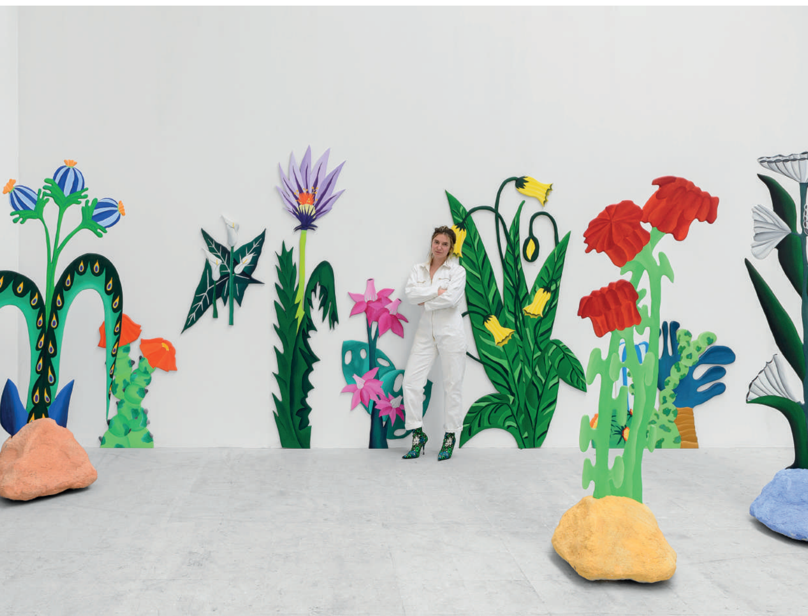
Vue de l'installation Cut Flowers Can't Die | 2022 | Peinture acrylique sur bois | Dimensions variables