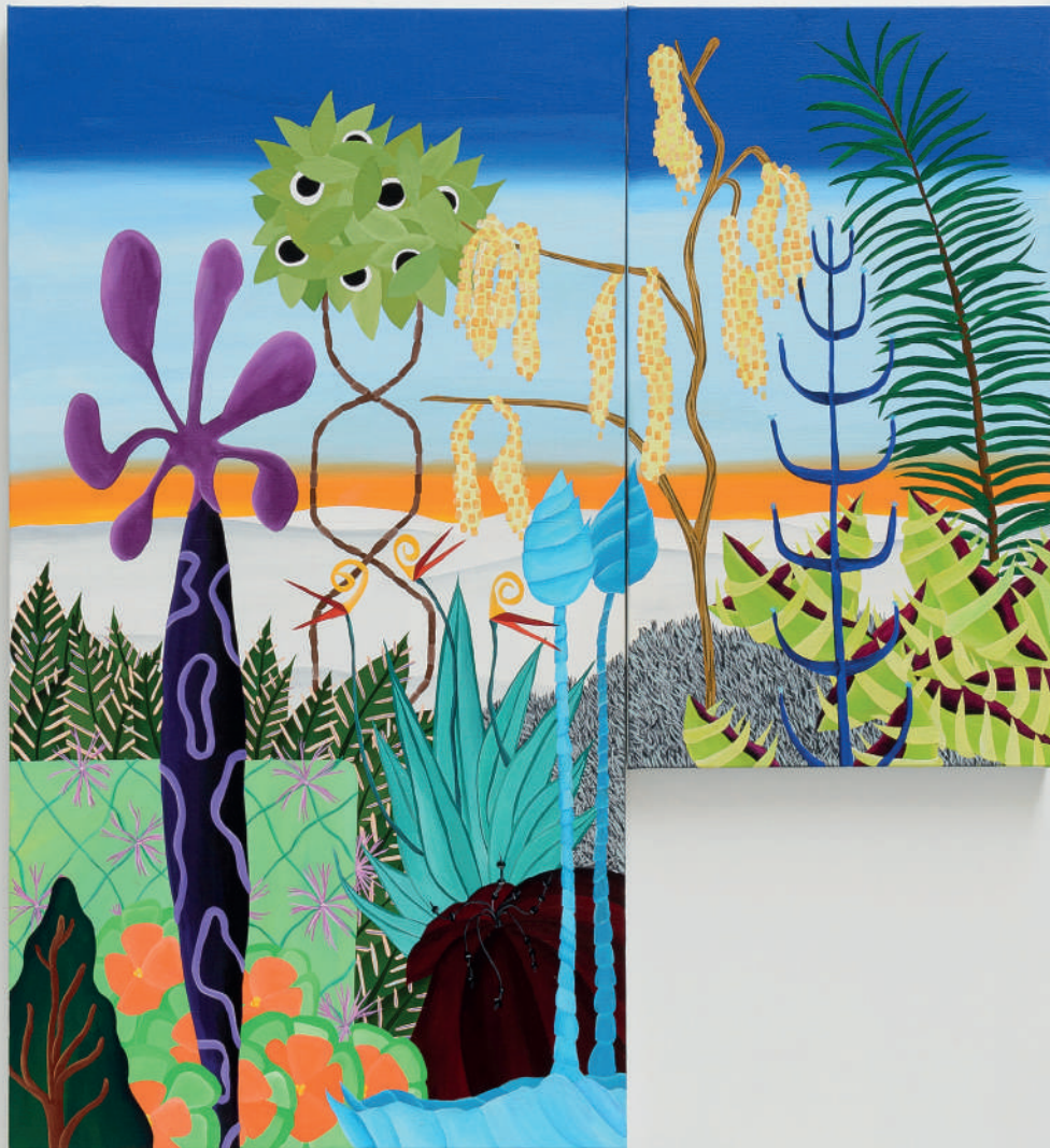
Megapixel III , 2022 Acrylique sur toile Polyptyque : 4 toiles - 141 x 174 cm Oasis I Paris I France