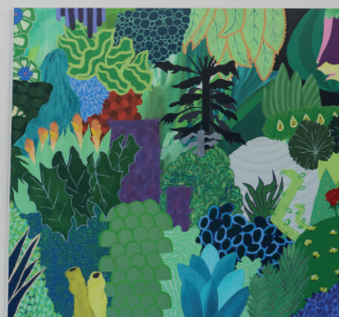
After Eden , Vue d'exposition, 2018 Iseult Perrault Touch with your eyes (détail) , 2017 Acrylique sur toile 170 x 200 cm x 5