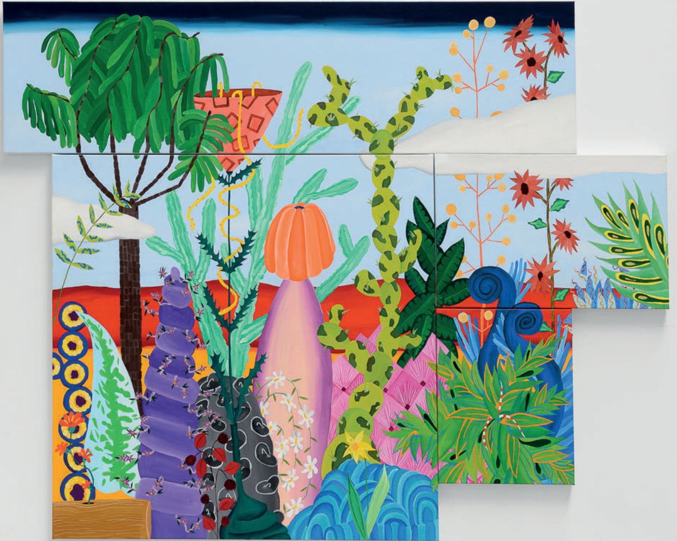
Megapixel II , 2022 Acrylique sur toile Polyptyque : 4 toiles - 141 x 174 cm Oasis | Paris | France