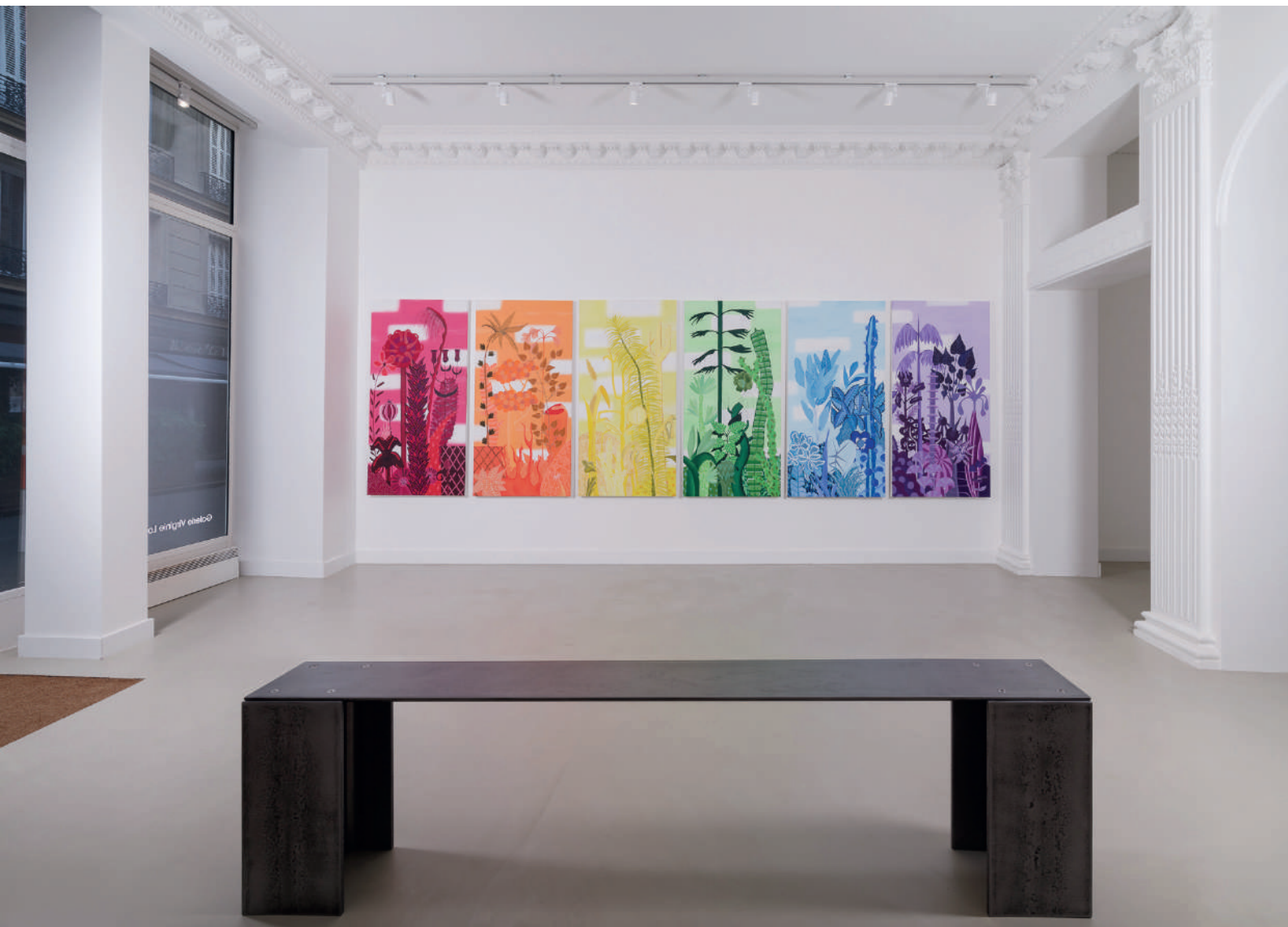
Every Cloud Has A Silver Lining - Vue d'exposition