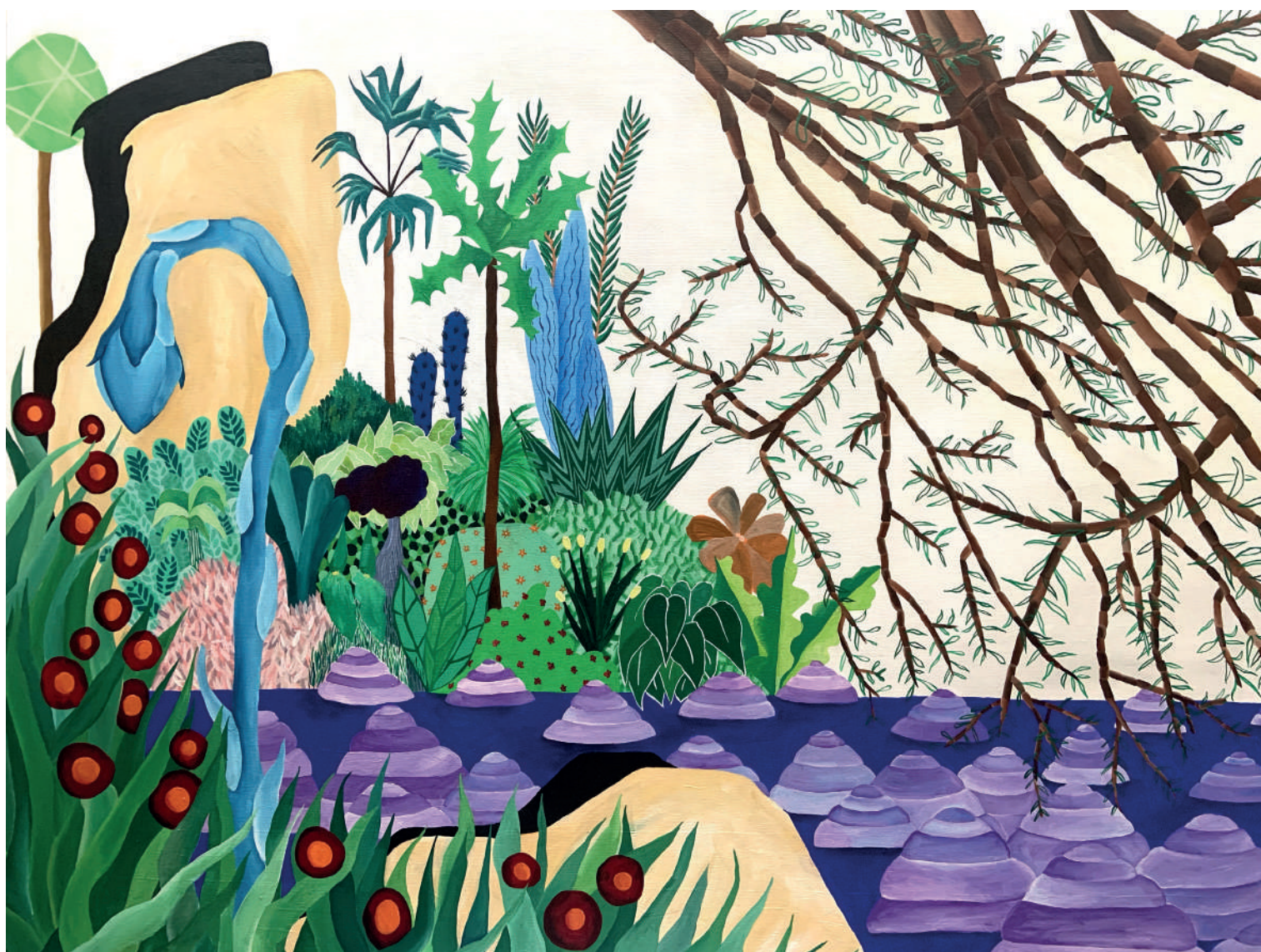
Iseult Perrault Sans titre, 2020 Acrylique sur toile 120 x 150 cm