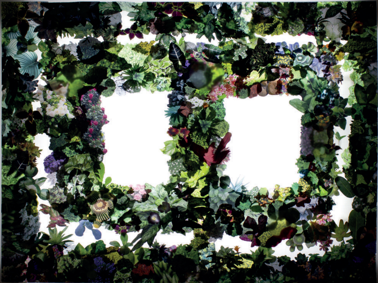
Landscape II , 2019 Papier découpé, plexiglass et néon 150 x 120 cm