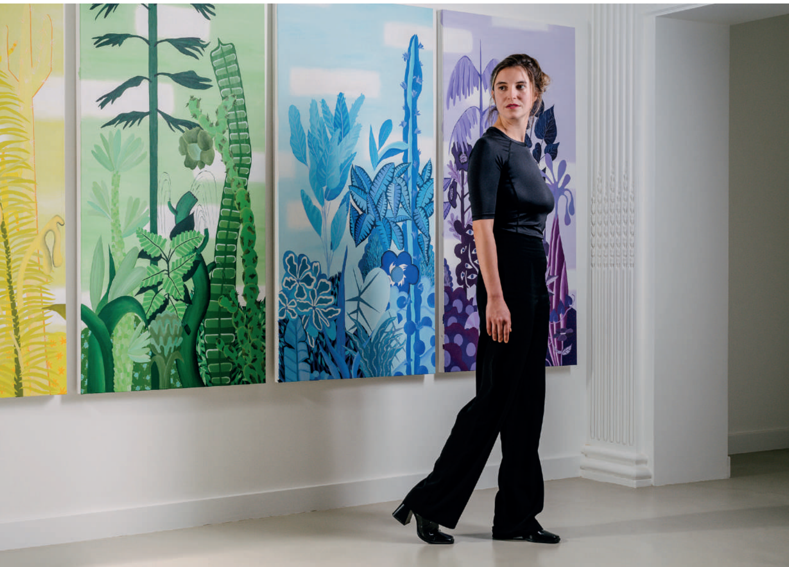
Every Cloud Has A Silver Lining - Vue d'exposition