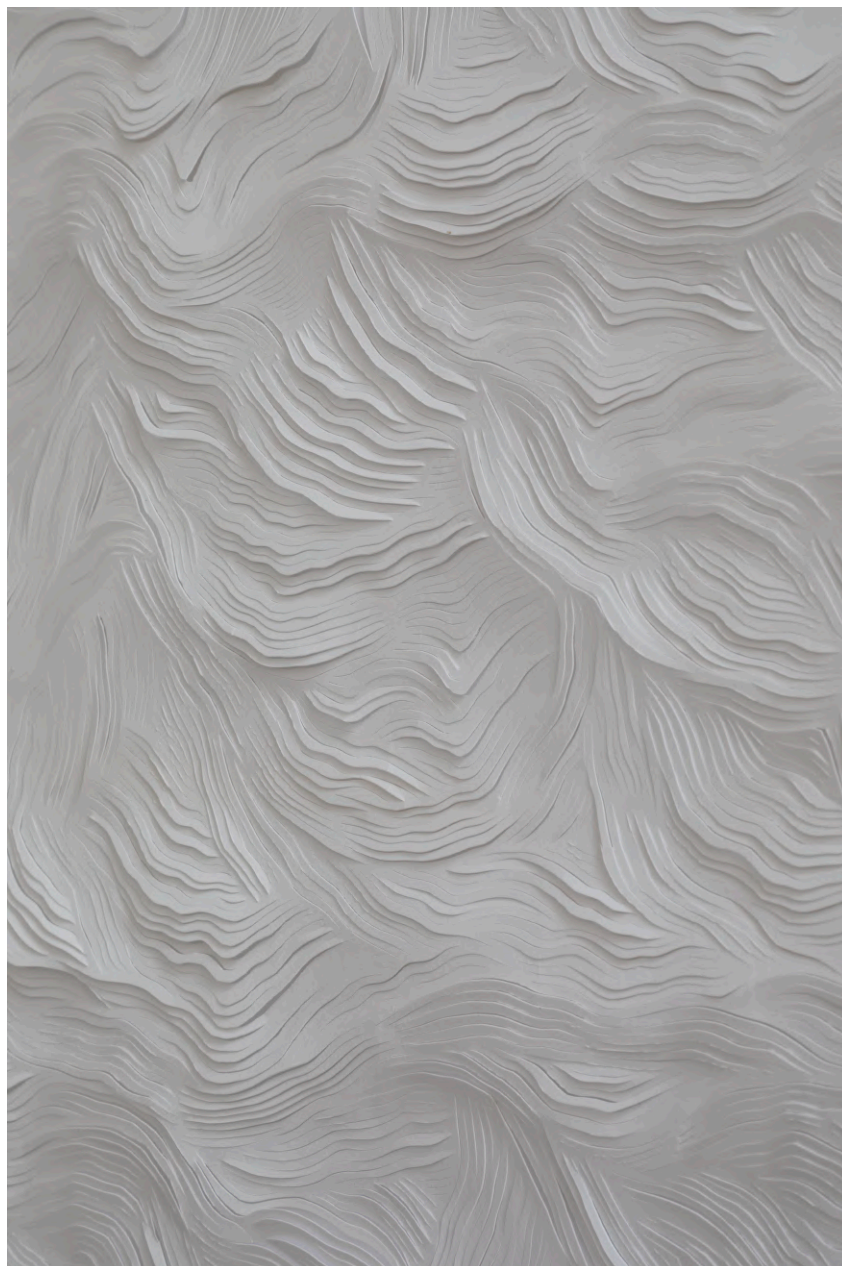
Giulia Manset Fluctuations VIII , 2019 (détail) Incisions sur papier 185 x 155 cm