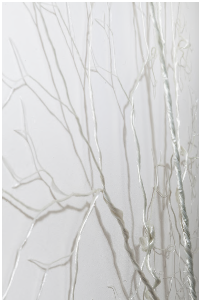
Janaina Mello Landini Ciclotrama 37 (Aglomeracão) , 2016 (détail) Corde en nylon blanc de 48 mm de diamètre brodée sur toile de lin 80 X 120 cm x 3